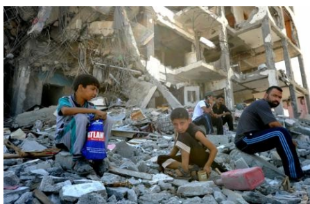
Dans les ruines de Gaza

de chaos » où la guerre est « un chacun-pour-soi dangereux et imprévisible dans une impunité totale. » Il est même allé jusqu'à dire que contrairement à la guerre froide, où « des mécanismes bien établis permettaient de gérer les relations entre les super-puissances », ces mécanismes font défaut « dans le monde multipolaire d'aujourd'hui. » Son constat est incontestable, mais sa solution, bien sûr, se résume à proposer de rendre l'ONU plus efficace, en ignorant que loin d'être un organe de paix, elle a toujours été